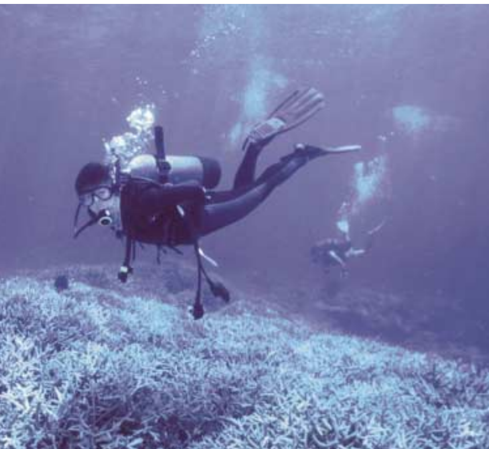
去年、沖縄で。まだ9本目くらいだったから姿勢が悪くて...と照れる。現地では出会ったベテランダイバーが撮り、メールで送ってくれた。