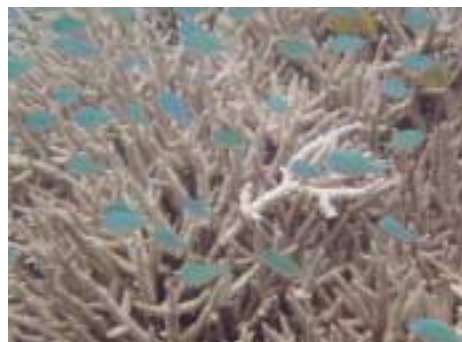
(上)エダサンゴに群れるスズメダイの一種。(沖縄・座間味島) (40ページ右上)イソギンチャクに隠れるハナヒラクマノミ。 (サイパン)

ベアのハマクマノミは、日本で見られる6種類 のクマノミの1つ。(沖縄・座間味島)